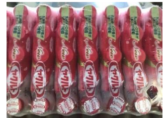
山口アポロ石油 株式会社さん