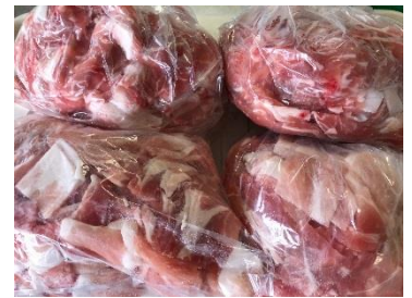
株式会社ヤクルト山陽 プティット事業さん