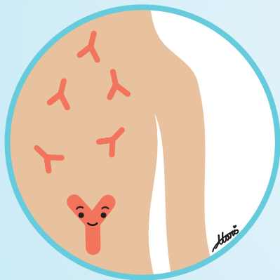
ママが 免疫(抗体)を作る