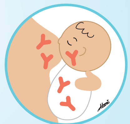
母乳から免疫(抗体)が 赤ちゃんへ